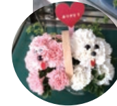
▲器、大きさや形もお好みで作ってくれる。水戸市内配達、アレンジ・花束とも3,300円～。

水戸市南町3-4-4 TEL029-221-3489 10:00~18:00 日曜不定休 ※5月第2日曜（母の日）は営業