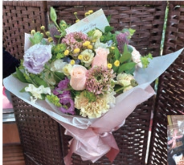
▶花束と花瓶を組み合わせるとは？