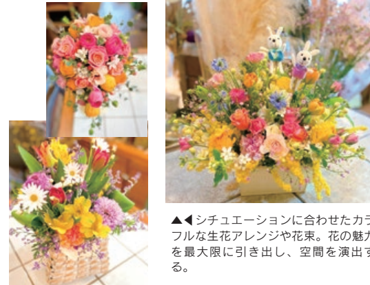
▲シチュエーションに合わせたカラフルな生花アレンジや花束。花の魅力を最大限に引き出し、空間を演出する。