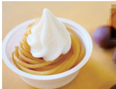
いわまの もんぶらんそふと

ミルキーなソフトクリームと濃厚なモ ンブランクリームがベストマッチの人気商 品。500円。