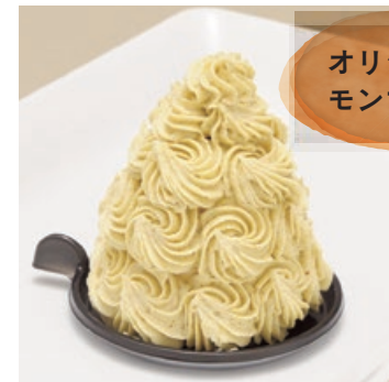
オリジナル モンブラン

笠間栗の自家製ペーストを使ったマロン クリームの中に、栗と洋梨のムースが入っ ている。9月中旬から発売予定。価格未定。