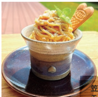
笠間栗の モンブラン パフェ

笠間市笠間1351-1 TEL.0296-71-6005 10:00~18:00 売り切れ次第終了 月曜定休 https://www.kasama-fuku.com