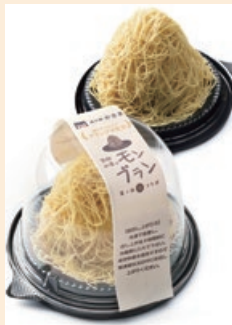
笠間和栗の モンブラン (冷凍)

笠間市手越22-1 TEL.0296-71-5355 直売所みどりの風9:00~18:00 第2木曜定休、11月まで無休 https://m-kasama.com