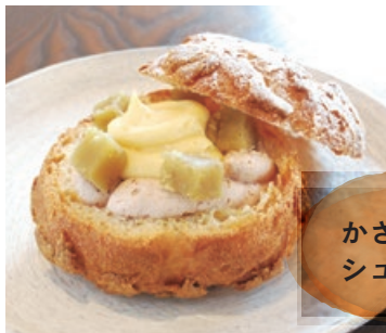
かさま シュークリ

写真は、通年OKの「くり」テイクアウト 399円。栗のシーズン限定で「スペシャル栗」 もある。イトインではモンブランも提供。