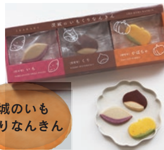
茨城のいも くりなんきん

笠間の栗のパウダーとチョコレートを使った「おち ぼ栗」と、行方市のさつまいも、那珂市のかぼちゃを 使ったクッキーの3つの味が楽しめる。1,296円。